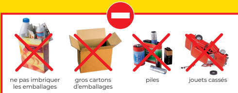
ne pas imbriquer les emballages